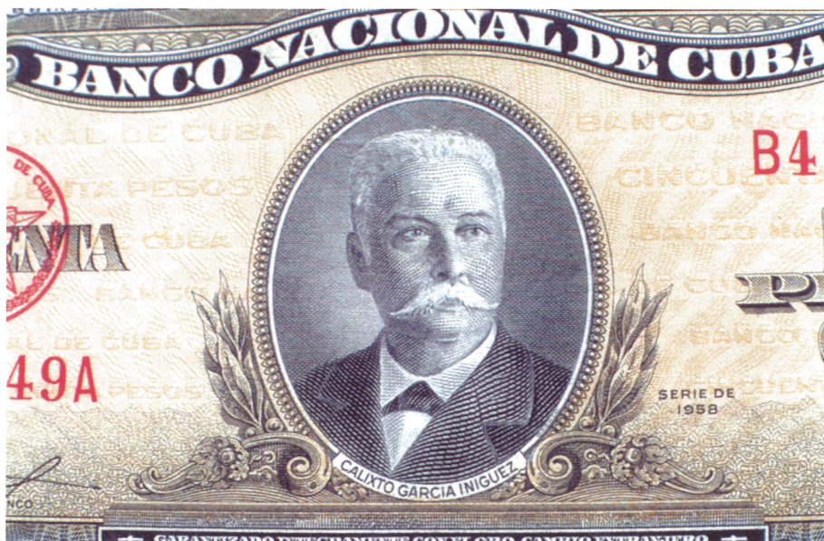
FIG. 1. Calixto García Íñiguez.