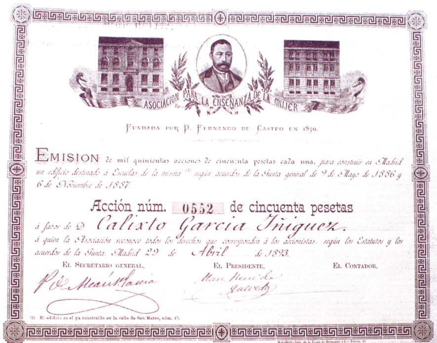
FIG. 12. Una de las acciones de Calixto García, 29 de abril de 1893.