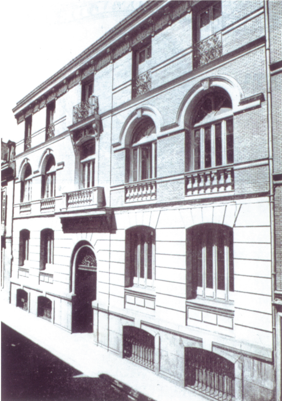
FIG. 2. Edificio de la Asociación para la Enseñanza de la Mujer.